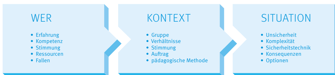
Abb. 2 — LEITFRAGEN ZUR RISIKOREDUKTION UND AUFDECKUNG „BLINDER FLECKEN“ (Streicher, 2014)